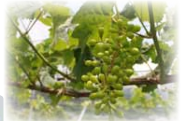
シャインマスカット